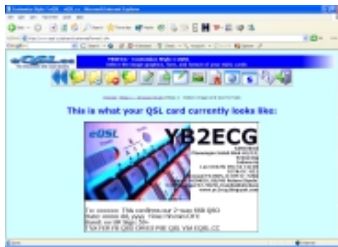
Layar My eQSL Design

My eQSL Design: digunakan memilih dan layout desain eQSL.