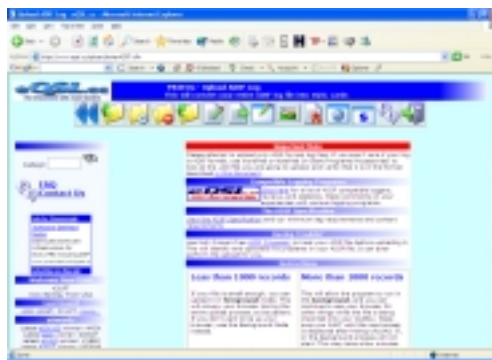
Layar Upload ADIF File

Untuk pengiriman multiple log akan sangat efisien kalau mempergunakan menu ini, terutama setelah mengikuti kontes, selain menconvert ke cabrillo, convert log Anda ke ADIF file kemudian baru diupload ke eQSL.cc. Lebih dulu Anda mengupload log akan dipermudah didalam mengkonfirmasi QSL card balasan. Apabila QSO dinyatakan valid, Anda tinggal confirm. Berbeda sekali apabila kita pada pihak yang menerima kiriman QSL, kita harus memverifikasi via log apakah QSL card yang dikirimkan benar-benar valid. eQSL mendukung beberapa mayor logger yang sering dipergunakan, compatible dengan N1MM, MixW dan Logger32, dll.